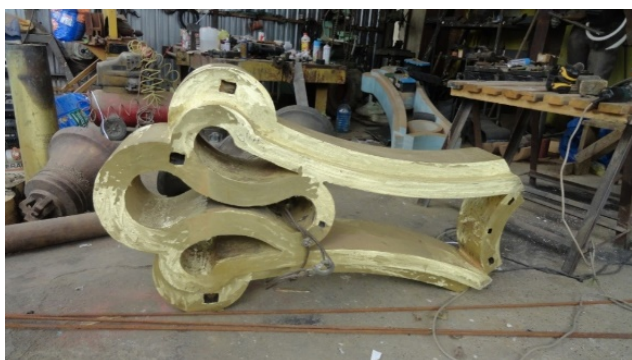
სურ. 5. ჯვრის ცალკეული ნაწილების ჩამოსხმა

მნიშვნელოვანი გაბარიტული ზომებიდან გამომდინარე, ჯვრის ჩამოსხმა ცნობილმა ოსტატებმა – მამა-შვილმა ოლეგ და პაატა გელაშვილებმა ეტაპობრივად განახორციელეს. ჩამოსასხმელი მაკეტის წინასწარ აგების შემდეგ მოხდა ჯვრის ოთხი ძირითადი ნაწილის ცალ-ცალკე ჩამოსხმა და დამუშავება (სურ. 5).