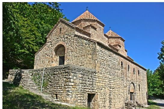
სურ. 2. გურჯაანის ყველაწმინდა ორგუმბათიანი ბაზილიკა

ტაძარზე აღმართული ჯვარი, როგორც წესი, აუცილებლად სფეროს ეყრდნობა, რომელიც სამყაროს განასახიერებს. ზოგიერთ ჯვარზე სფეროსთან ერთად ვხვდებით ნახევარმთვარესაც (სურ.3). აღსანიშნავია, რომ ეს დეტალი არ არის დაკავშირებული ისლამთან ან მის რაიმე გავლენასთან. ნახევარმთვარე იყო ბიზანტიის სახელმწიფოს სიმბოლო და იმპერატორის უსაზღვრო ძალაუფლებას გამო-