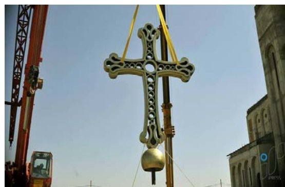
სურ. 7. ჯვრის აღმართვა

ტაძრის გუმბათის თავზე სპეციალურად აგებულ ჩამაგრების კვანძამდე ჯვრის აწევამდე მისი ოთხივე ძირითადი ნაწილი ცენტრალური წრის გარშემო გაერთიანდა. ჯვრის ქვედა ფეხში ჩამოსხმის პროცესშივე ჩამონტაჟდა ჩასამაგრებელი მილი, რომელიც გამოყენებული იყო ასევე საყრდენი სფეროს მოსაწყობად (სურ. 7).