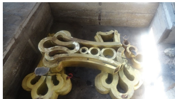
სურ. 6. ჯვრის ჩამოსხმული წრეების დამონტაჟება

მომდევნო ეტაპს წარმოადგენდა ჯვრის ნაწილების კედლებს შორის ჩასასმელი სხვადასხვა ზომის წრის ჩამოსხმა და მათი დამონტაჟება (სურ. 6).