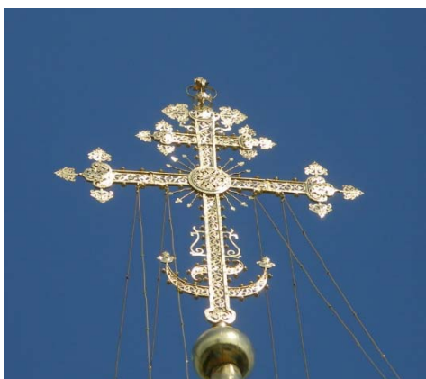
სურ.3. ტაძარზე აღმართული ჯვარი სფეროთი და ნახევარმთვარით

ხატავდა. მხოლოდ 1453 წელს, კონსტანტინოპოლის თურქების მიერ აღების შემდეგ, ხდება ოსმალეთის იმპერიის ოფიციალური ემბლემა. აქედან გამომდინარე, ჯვარზე არსებული ნახევარმთვარე ქრისტეს მეფობას და მის ზეადმატებულებას უსვამს ხაზს.