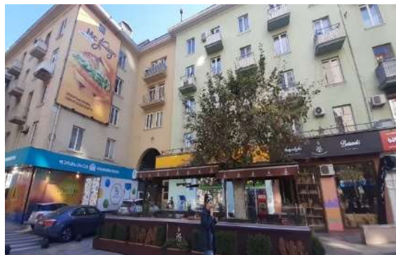
სურ.12 ფასადი გამზირის მხრიდან