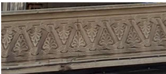
სურ. 7 პირველი სართულის ორნამენტი