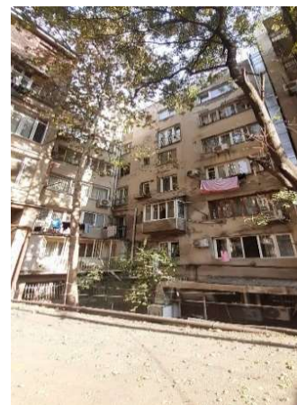
სურ.17 ფასადი ეზოს მხრიდან