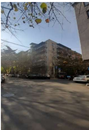
სურ.15 საცხ. სახლი ყაზბეგის ქუჩაზე.

საცხოვრებელი სახლის ფასადი, როგორც ქუჩის ისე ეზოს მხრიდან სახეცვლილია, რაც ვლინდება მიშენებებითა და აივნების გაუქმებით (სურ.17). სადარბაზოში ზოგიერთ სართულზე შემორჩენილია პირვანდელი ხის კარები (სურ. 18,19). თითოეულ სართულზე ორი ხის კარი დერეფნის სისტემით აკავშირებდა რამდენიმე მობინადრეს. ავთენტურად შემორჩენილი, ხის კარით იზოლირებული საერთო ჰოლი სამეზობლოს კომუნიკაციის ფუნქციას და თბილ ატმოსფეროს დღესაც ატარებს.