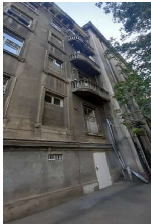
სურ. 5 რიკულებიანი აივანი