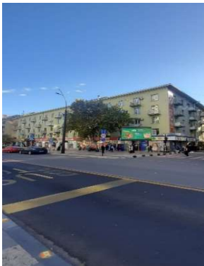
სურ.11 საცხ. სახლი ი.ჭავჭავაძის გამზირზე.