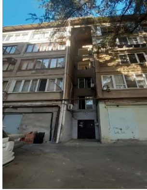
სურ.13 ფასადი ეზოს მხრიდან