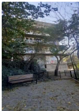
სურ. 21, 22 საცხ. სახლი ვ. ანჯაფარიძის ქუჩაზე