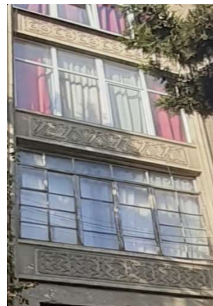
სურ.6 ფასადი ეზოს მხრიდან