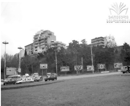
სურ. 20 ფიქრის გორა, საქართველოს პარლამენტის ეროვნული ბიბლიოთეკა.

თობია ხუთსართულიანი ინდივიდუალური პროექტი ინტელიგენციის ფენისთვის იყო განკუთვნილი. ბრტყელი გადახურვა, დიდი, ნათელი, ვიტრაჟული ფანჯრები, ლითონის მარტივი კონსტრუქციის სიმეტრიული აივნები და თავისუფალი გეგმარება განსაზღვრავს შენობის მოდერნისტულ იერს. ვარაზისხევის მხრიდან შენობას გარს უვლის ლითონის თხელ პროფილიანი აივანი, რაც დამატებითი ხიბლია სივრცითი პეიზაჟის აღქმისთვის (სურ.22). საცხოვრებელი სახლის დიდი ფანჯრები იმ პერიოდის საბჭოთა არქიტექტურაში უცხო თემა იყო. ბუნების მიმართ მაქსიმალური გახსნილობა შენობის მთავარი ხიბლია, რითაც დღემდე არ კარგავს პროექტი ინტერესს და პოპულარობას.