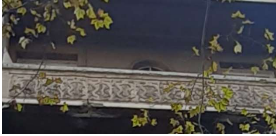
სურ. 9 მესამე სართულის ორნამენტი