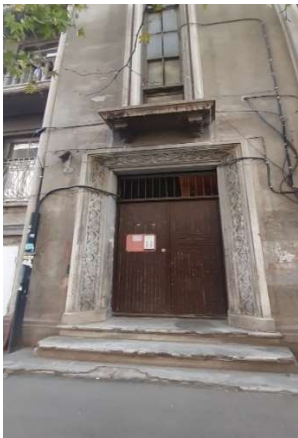
სურ. 4 სადარბაზოს კარი

შენობის ექსტერიერის გაფორმება მეტყველებს იმ ფაქტზე, რომ ავტორი კარგად იცნობს ქართულ ორნამენტულ სკოლას. ფასადის დამუშავება გაწაფული მხატვრის კალიგრაფიას ჰგავს. ცნობილია, რომ ლადო ალექსი-მესხიშვილის წინაპრები კალიგრაფები იყვნენ. ეს ობიექტიც დახვეწილი არქიტექტურული კალიგრაფიის მაგალითია. საცხოვრებელი სახლი არ არის მოპირკეთებული. ის მხოლოდ ბეტონითაა დამუშავებული. ბეტონის ესთეტიკა და მასში გაცოცხლებული ნაციონალური მოტივები შენობას განსაკუთრებულ გამომსახველობას და მხატვრულობას სძენს.