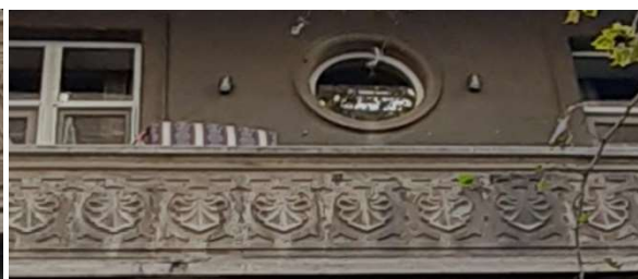
სურ. 8 მეორე სართულის ორნამენტი