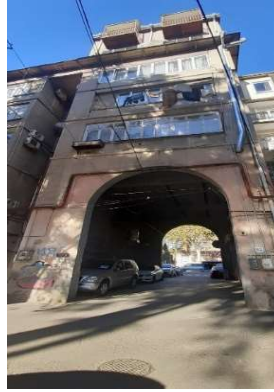
სურ.14 ეზოში შესასვლელი თაღი

1961 წელს საქართველოს სსრ-ის მინისტრთა საბჭომ გასცა ნებართვა თბილისში, ყაზბეგის ქუჩაზე (ახლანდელი ე. ტატიშვილის ქუჩა ქ. N17) სამი ერთსართულიანი სახლის დანგრევის შესახებ. 1962 წელს ამ ადგილას არქიტექტორების ლადო ალექსი-მესხიშვილისა და ნოდარ ვადაჭკორიას პროექტით აშენდა შვიდსართულიანი საცხოვრებელი სახლი (სურ.15). კუთხის სადა კორპუსს ერთი სადარბაზო აქვს. ქუჩის მხრიდან ფასადს სიმეტრიულად და ლენტისებურად გასდევს აივნები და ფანჯრები. სადარბაზოს დაბალი შესასვლელის თავზე შენობის გარედან დამონტაჟებული ლიფტის მსუბუქად გადატიხრული და ნაწილობრივ შემინული შახტაა, რომელიც სრულდება კომპურა შვერილით (სურ.