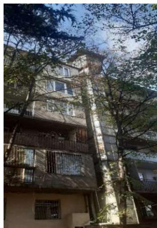
სურ.16 ფასადი ქუჩის მხრიდან