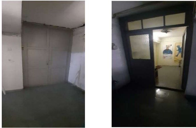
სურ. 18,19 სადარბაზოს პირვანდელი ხის კარი

ლადო ალექსი-მესხიშვილის მეოთხე საცხოვრებელი სახლი შედარებით გვიანი პერიოდისაა. 1965-1970 წლებში თბილისში, ფიქრის გორაზე, ვ. ანჯაფარიძის ქუჩაზე N9 აშენდა 5-ბინიანი საცხოვრებელი სახლი (სურ. 21).