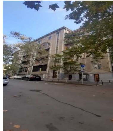
სურ. 1 ლ. ბოცვაძის ქ. N2

რო გარემოს უზრუნველყოფს. მცენარეული მოტივით დამშვენებული აივნები, მართკუთხა და წრიული ფორმის ფანჯრების სიმეტრიული განაწილება, გვერდითი ნახევარწრიული აივნების გამოყვანილი რიკულები, კარ-ფანჯრის საპირეები უაღრესად დახვეწილი და პლასტიკურია.