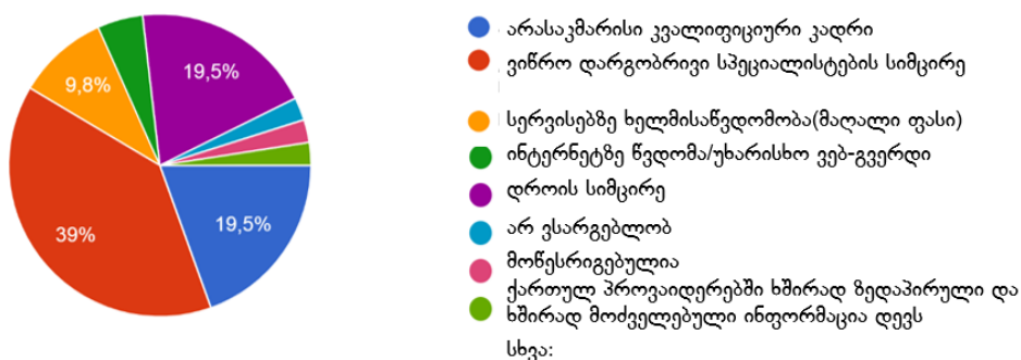
4. რა ტიპის სირთულეებს ხედავთ აგროსაინფორმაციო სისტემაში, ან აგროსაინფორმაციო სერვისებიდან ინფორმაციის მისაღებად? 41 პასუხი

მომხმარებელთა უმრავლესობა ინფორმაციის მისაღებად ძირითადად დამოკიდებულია ინტერნეტსერვისებსა (65,9%) და სოფლის მეურნეობისა და გარემოს დაცვის სამინისტროს მიერ შეთავაზებულ სერვისებზე (26,8%), ხოლო 7,3%-ისთვის ინფორმა-