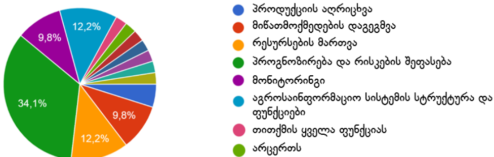
17. თქვენი აზრით, რომელ ფუნქციებს ფარავს აგროსაინფორმაციო სისტემა? 41 პასუხი

ანალიზისა და მონიტორინგის პროცესში გამოკითხულთა ნახევარზე მეტი იყენებს კვარტალურ და წლიურ ანგარიშებს და მომხმარებელთა უკუკავშირის (იხ.დიაგრამა 4), 7,3% – შეფასების ინდიკატორებზე დაფუძნებულ მეთოდებს, 4,9% – შიდა აუდიტს, ხოლო 34,1%-ს არ ეხება ანალიზი და მონიტორინგი.